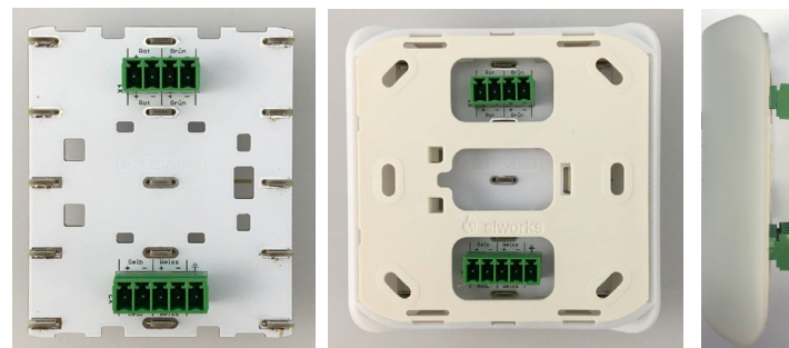
Abbildung 2: alero Raumanzeigelampe ohne Deckel / Rückansicht / Seitenansicht

ESD- und Sicherheits-Vorschriften sind beim Einbau stets einzuhalten. Das Gerät darf nur im spannungslosen Zustand der Einspeisung angeschlossen werden.